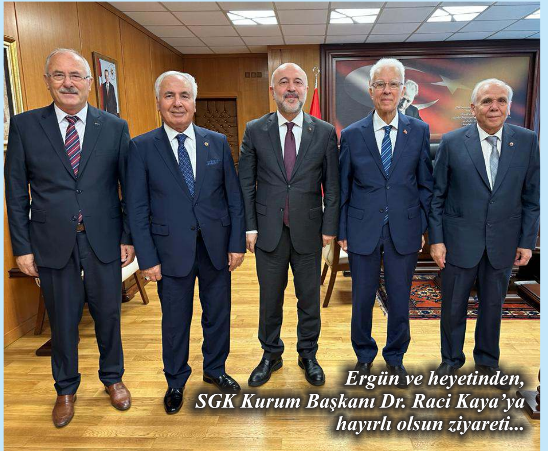
Ergün ve heyetinden, SGK Kurum Başkanı Dr. Raci Kaya'ya hayırlı olsun ziyareti...

Ergün Başkanlığındaki TÜED heyeti Kaya'ya hayırlı olsun temennilerini sunarken, emeklilerin çözüm bekleyen sorunları da masaya yatırıldı. İntibak başta olmak üzere emeklinin çözüm bekleyen çok fazla sorununun olduğunu dile getiren Ergün; "SGK hepimizin tek ve vazgeçilmez çatısıdır. Çalışanlar, emekliler ve işverenler olarak bu kurumu yaşatmak ve büyütme zorundayız. Bugün ve gelecekte emeklilerimizin durumlarının iyileştirilmesi de buna bağlıdır" dedi.