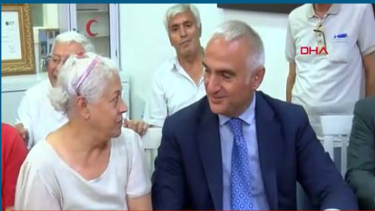
BAKAN ERSOY'DAN ÜSKÜDAR ZİYARETİ Turizm Bakanı Mehmet Nuri Ersoy AK Parti İstanbul İl Başkanlığı'na düzenlenen, "Yüz Yüze 100"