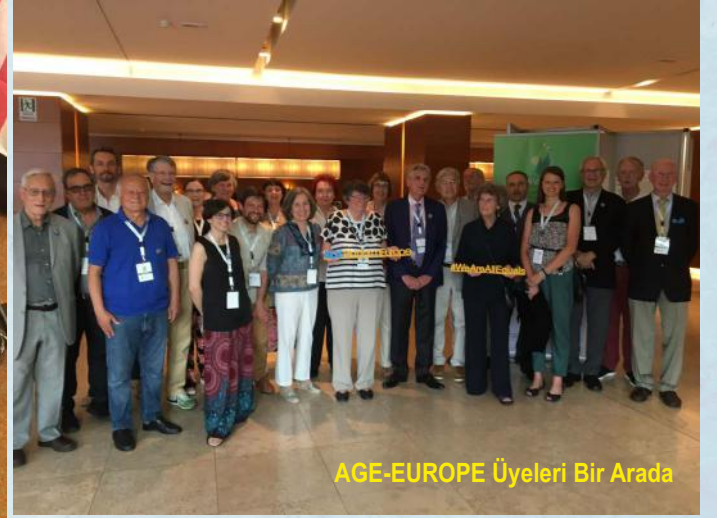
AGE-EUROPE Üyeleri Bir Arada

BM 5.UNECE Yaşlanma Bakanlar Konferansı ve Sivil Toplum Ortak Forumu 15/17 Haziran tarihlerinde İtalya Hükümeti'nin ev sahipliğinde Roma'da gerçekleştirildi. Etkinlikte Madrid Uluslararası Yaşlanma Eylem Planı ve Bölgesel Uygulama Stratejisinin (MIPAA/RIS) kabul edilmesinin 20. Yılı da kutlandı.