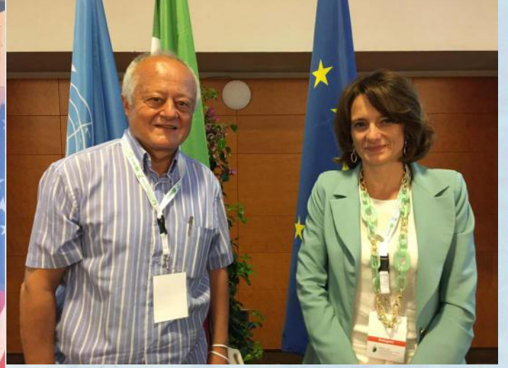
Yazıcıoğlu, İtalya Fırsat Eşitliği ve Aile Bakanı Elena Bonetti ile