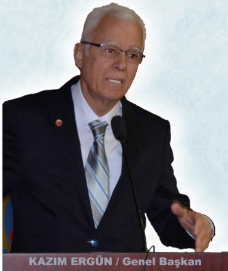
KAZIM ERGÜN / Genel Başkan

Türkiye Emekliler Derneği Genel Başkanımız Kazım Ergün AA'ya verdiği demeçte; memur ve memur emeklileri için gündemde olan 3600 ek gösterge kapsamının; öğretmen, polis, hemşire ve din görevlileri ile sınırlandırılmasının yeni tartışmalara neden olacağından, memur emeklilerimizin de iyileştirme kapsamına alınmasını talep etti. Memurlar ve memur emeklileri arasında eşitliğin gözetilmesini isteyen Ergün, ek göstergenin kapsamının geniş tutulmasıyla aylıklarda ve ikramiye farklarında dengenin korunacağını söyledi.