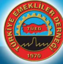
Mehmet Emin TANGÖREN TÜED Basın Danışmanı

İLGİ: 11.05.1977 gün ve 394 sayılı yazınız.