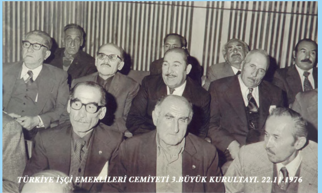
TÜRKİYE İŞÇİ EMEKLİLERİ CEMİYETİ 3.BÜYÜK KURULTAYI. 22.11.1976