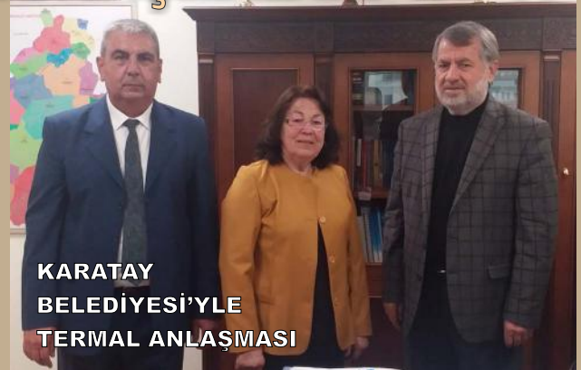
KARATAY BELEDİYESİ'YLE TERMAL ANLAŞMASI