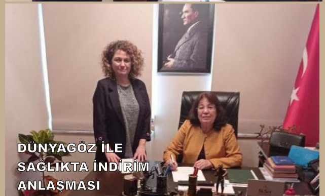
DÜNYAGÖZ İLE SAĞLIKTA İNDİRİM ANLAŞMASI