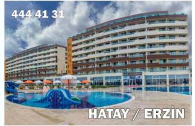
Hattuşa Vacation Thermal Club Erzin