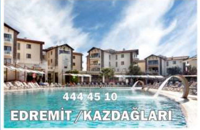
Hattuşa Vacation Thermal Club Edremit