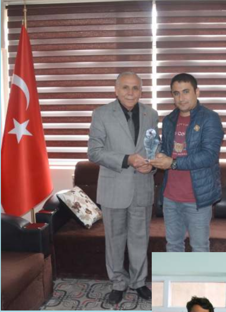
BİRİNCİLİK ÖDÜLÜ KAHRAMANMARAŞ'A...