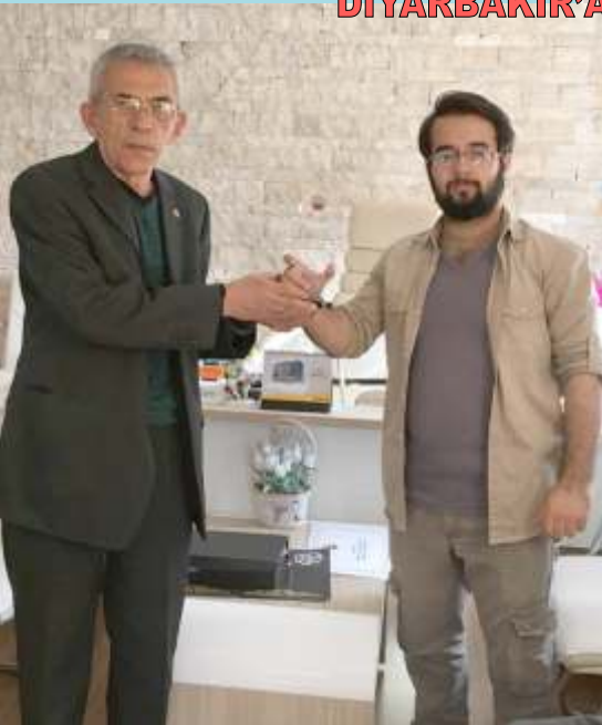
ÜÇÜNCÜLÜK ÖDÜLÜ AYDIN'A...